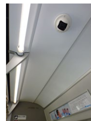
車内の防犯カメラ

テロの未然防止や防犯を目的に、主な駅や新幹線および在来線の一部列車の車内には防犯カメラを設置しており、今後も整備を進めていきます。また、駅では視認性を高めた透明のゴミ箱を設置しています。加えて、新幹線および在来線の一部列車では、車内警戒警備を強化するとともに、防護装備の車両への搭載、警察や消防・医療機関等と連携した訓練の実施等、さらなるセキュリティの向上を図っています。