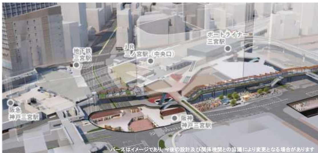
JR三ノ宮新駅ビル及びその周辺の乗換動線イメージ