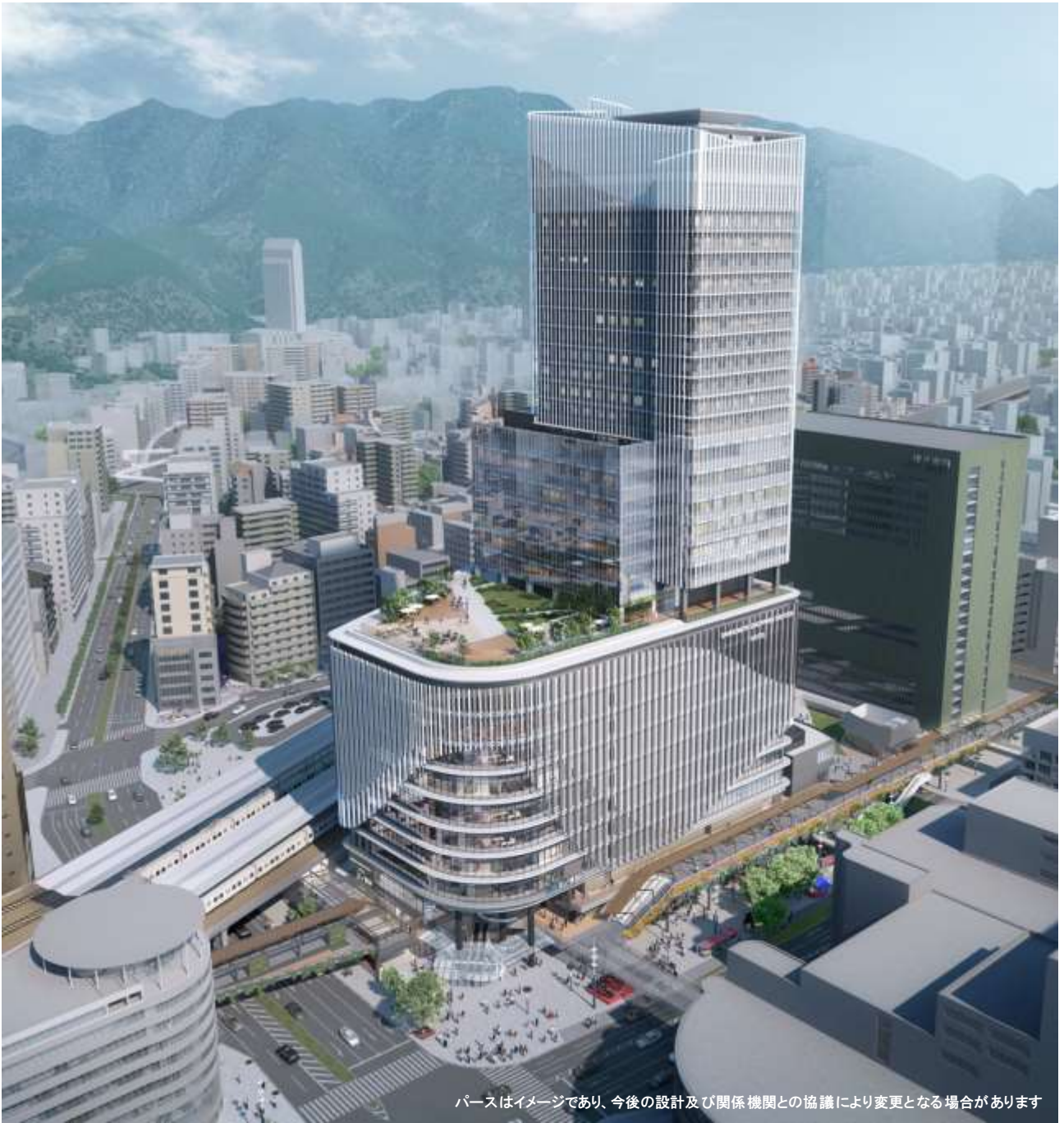
J R三ノ宮新駅ビル外観（全景）