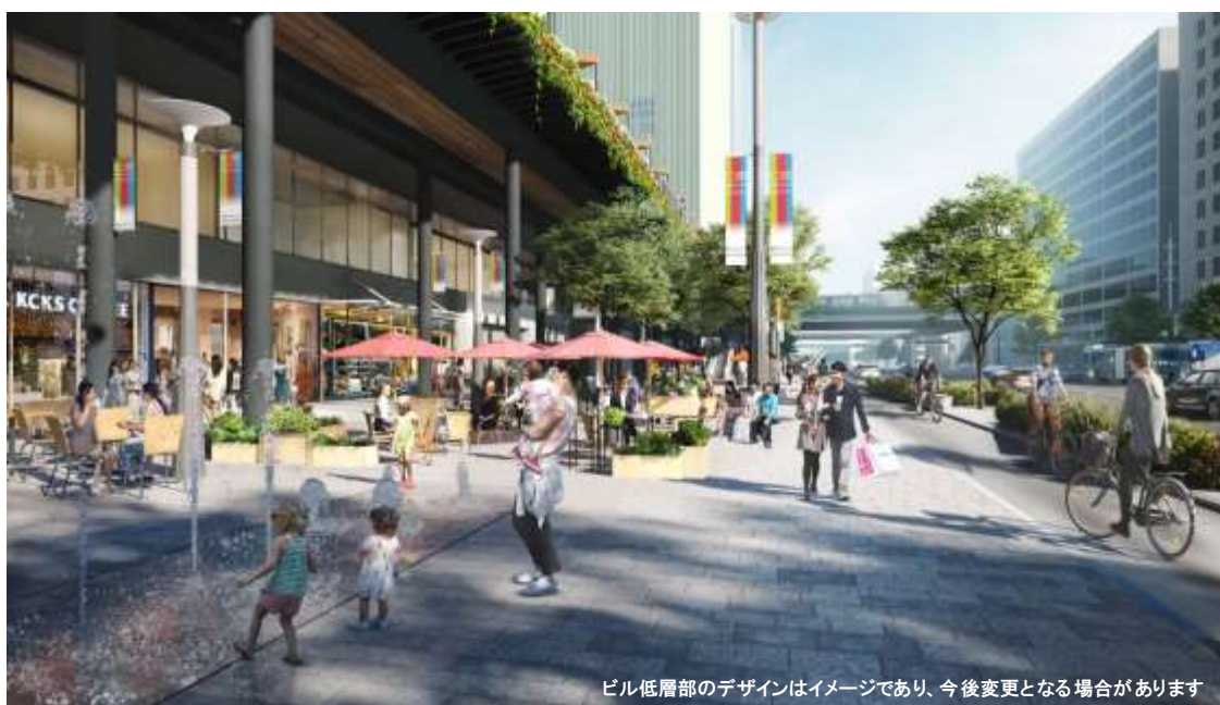
三宮クロススクエア（東側・第1段階）のイメージ