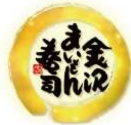
◆ にぎり寿司/金沢まいもん寿司