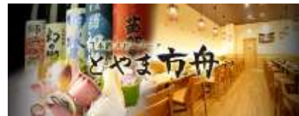
◆炙り寿司/日本酒スローフード とやま方舟