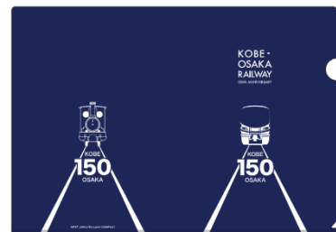
記念クリアファイル