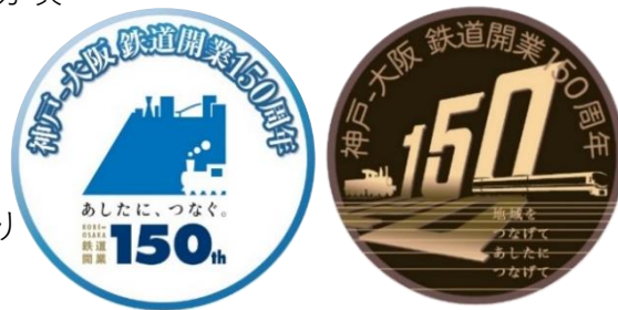
記念ヘッドマークシール