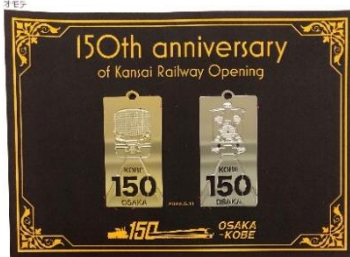
特製金属しおり(記念台紙付:非売品)

クイズ大会の上位入賞者には「150周年記念 特製金属しおり」などを、また当選者で当日参加の方全員に「150周年記念クリアファイル」をプレゼントします。