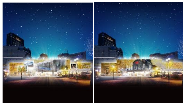
プロジェクションマッピング（イメージ）

※詳細は 「神戸駅周辺でのイベント等の開催について」 （4月5日プレスリリース）参照