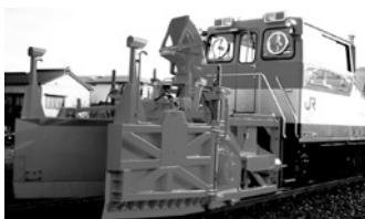
モーターカーロータリーMCR-600