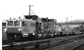
新幹線用まくらぎ交換機編成