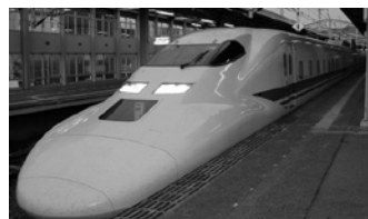
電気軌道総合試験車(ドクターイエロー)